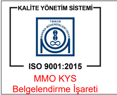
Şekil 2: MMO KYS Belgelendirme İşaretinin tek başına kullanımı