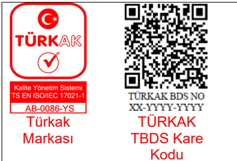
Şekil 4: MMO, düzenleyeceği sertifikalarda TÜRKAK markasının ile birlikte TÜRKAK Belge Doğrulama Sistemi'nin ürettiği TBDS Kare Kodu kullanımı.