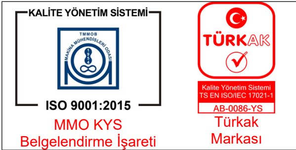
Şekil 3: MMO KYS Belgelendirme İşaretinin akreditasyon markasıyla birlikte kullanımı